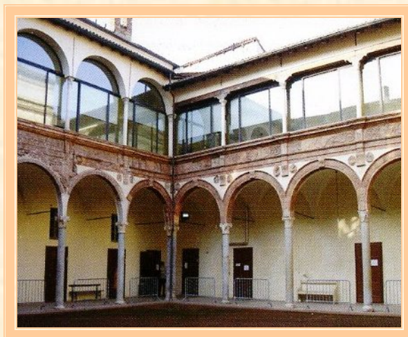
Interno del Tribunale di Piacenza